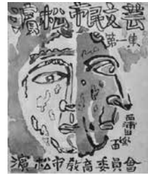
紙表集第一市民文芸会 第一集第一市民文芸会

浜松市民文芸第1集は、昭和三十一年（1956年）三月、浜松市教育委員会によって発行されました。市民が主役の市民のみなさんのための文芸冊子づくりを目指したもので、その後、毎年の発行という長い歴史を積み重ね、今回で誕生から七十年を超え、第71集となりました。