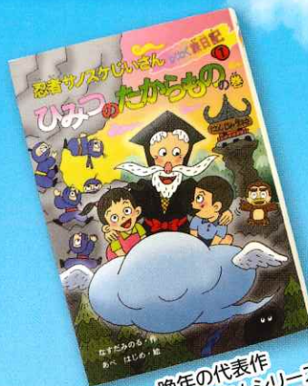
晩年の代表作 「サノスケじいさんシリーズ」