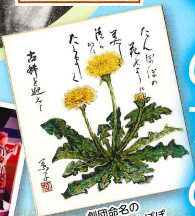
劇団命名の 由来となったたんぽぽ