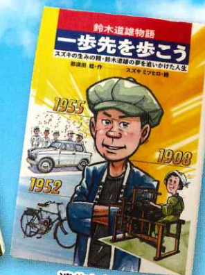
遺作となった 「鈴木道雄物語」