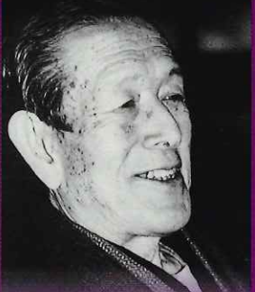
百合山 羽公 詩情豊かな 蛇笏賞俳人